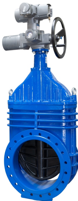
Ábra: 2911 DN500